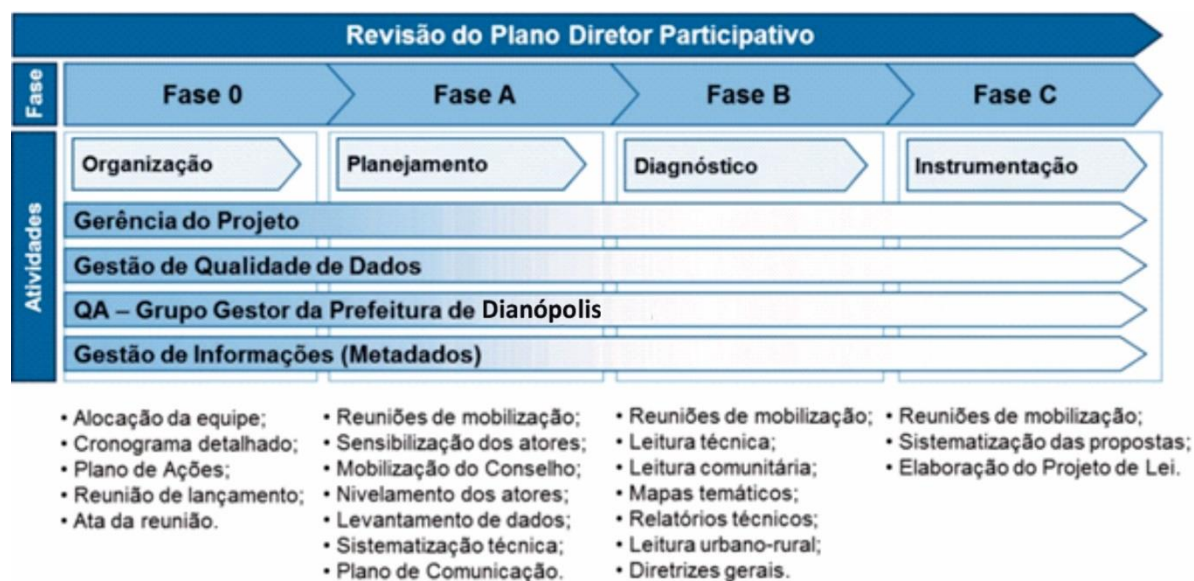
Figura 2. Escopo geral dos serviços contemplados nesse plano de trabalho.